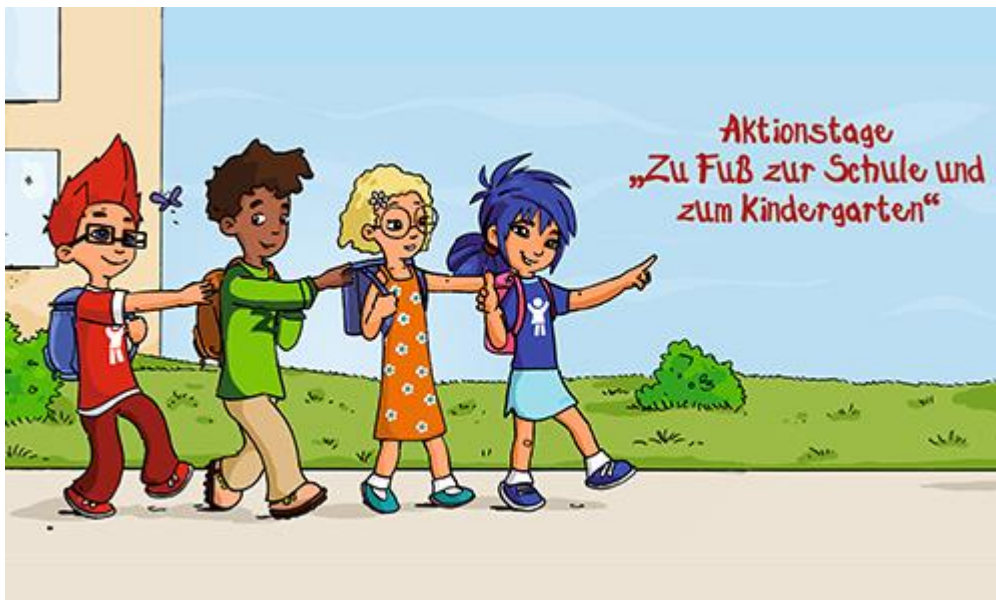
Illustration: Deutsches Kinderhilfswerk e.V.

Aktionstage "Zu Fuß zur Schule und zum Kindergarten" vom 18. – 29.09.2023