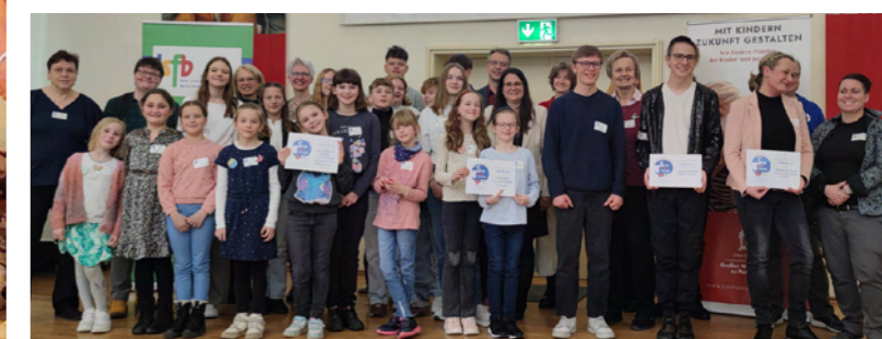
Preisverleihungen Anerkennungspreise in Berlin (li.) und Potsdam 2025