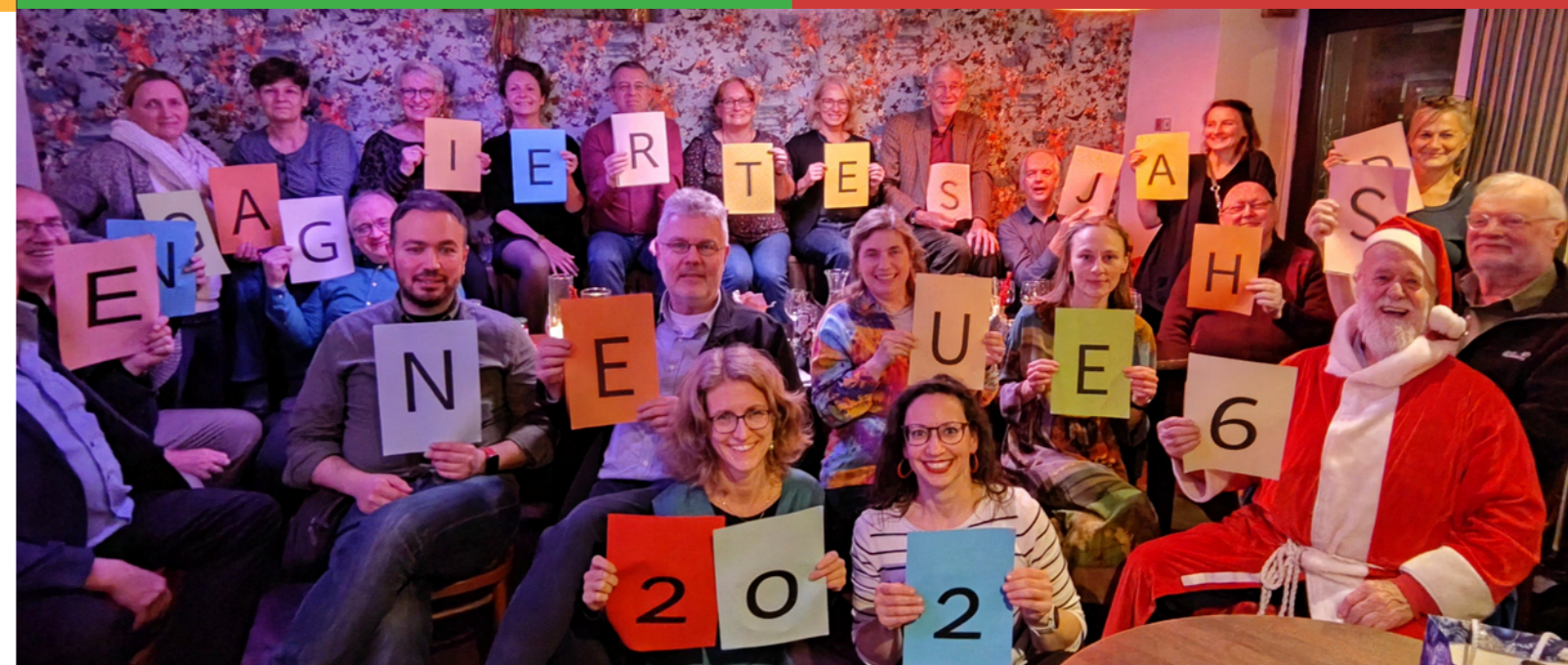
Das Team vom Isfb, Dezember 2025